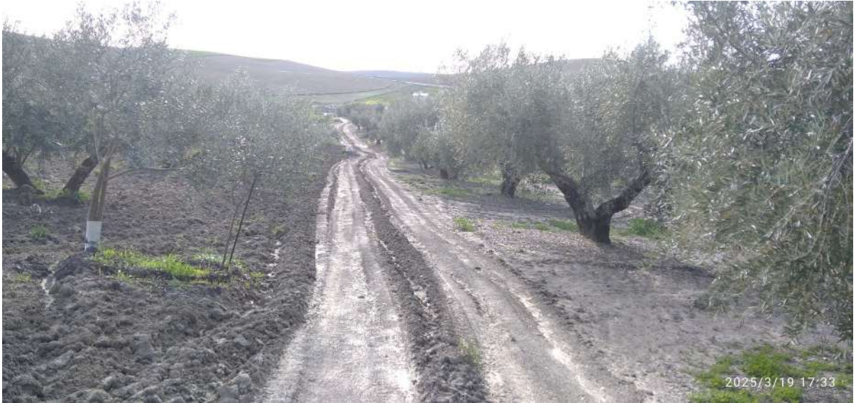
Camino 15. Camino de Salamanca